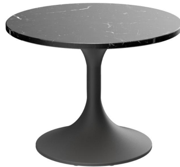
TABLE BASSE CAIUS