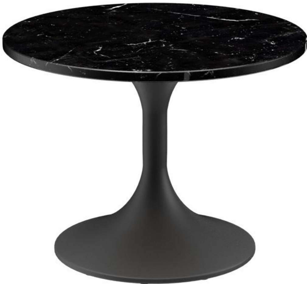
TABLE BASSE CAIUS