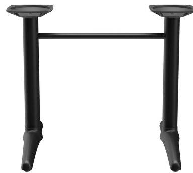
TABLE À MANGER KENAN