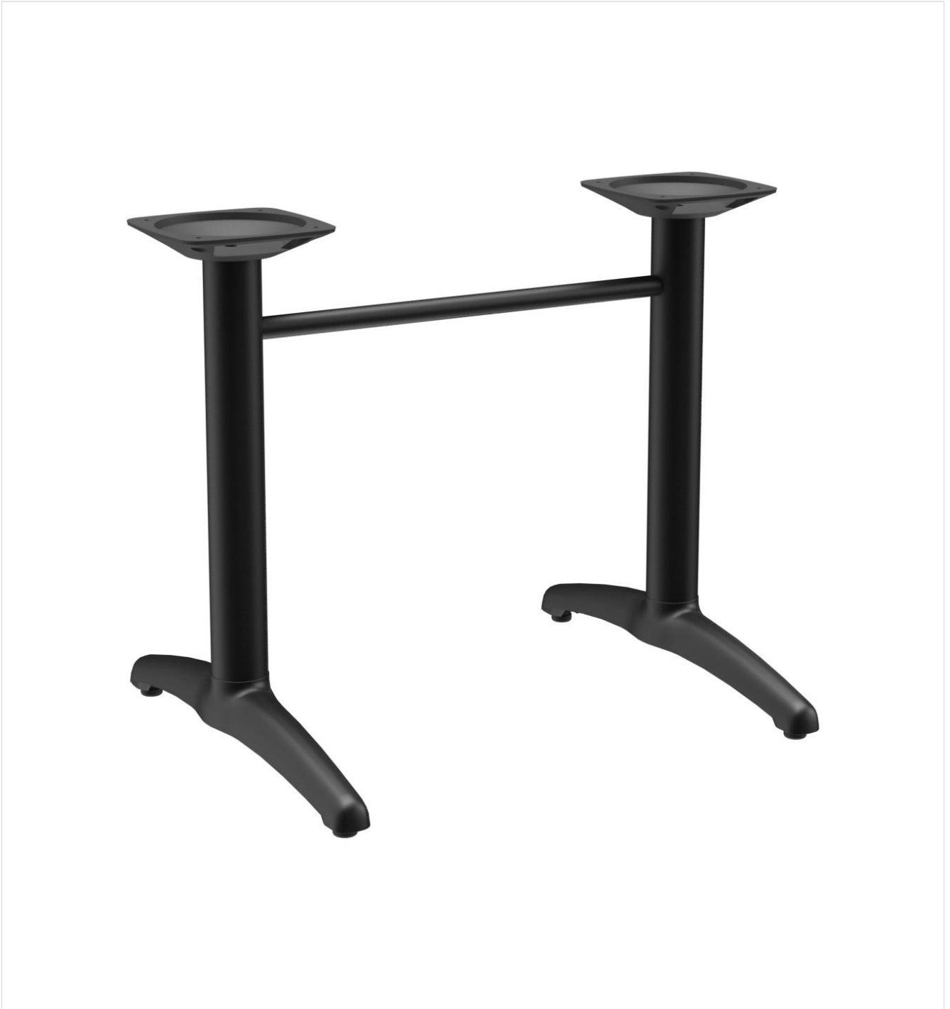
TABLE À MANGER KENAN