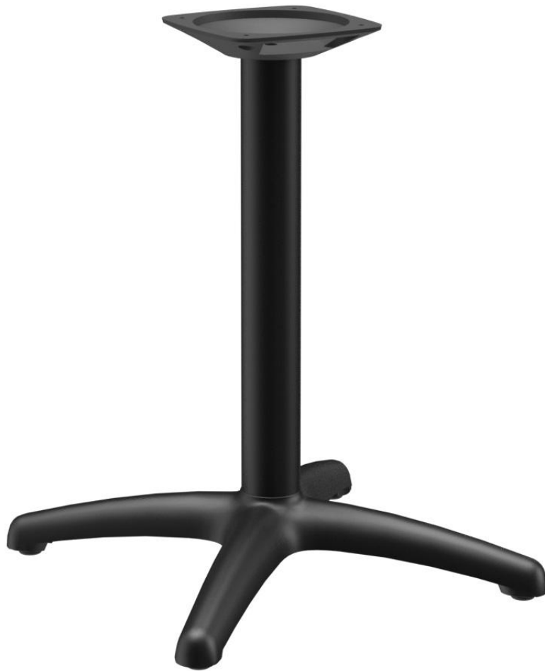
TABLE À MANGER KENAN