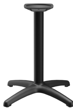
TABLE À MANGER KENAN